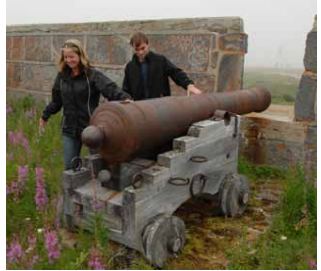
Ang Prince of Wales Fort National Historic Site

Katulad ng kuwardo ng isang pintor, sa tag-init ang tanawin ng Churchill ay may namumukadkad na mga ligaw na bulaklak sa anumang bawat kulay na kayang maisip. May mahigit sa 400 uri ng mga katutubong halaman sa lugar, ginagawang perpekto ang kapaligiran para sa isang paglalakad ng mahaba. Gumala-gala sa tundra at sa kahabaan ng baybayin ng Hudson Bay kapag mababa ang tubig. Para sa mga naghahanap ng kaunting bilis, subukan ang pagpaparagos (dog sledding) sa isang karitong may gulong – ang kakulangan ng niyebe ay hindi magpapabagal sa mga asong ito.