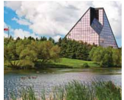
Ang Royal Canadian Mint