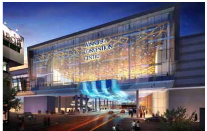
Ang Winnipeg Convention Centre