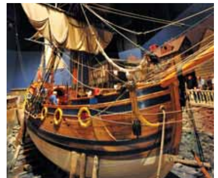
Ang Nonsuch - Ang Manitoba Museum