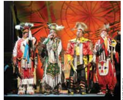
Ang Manito Ahbee Festival