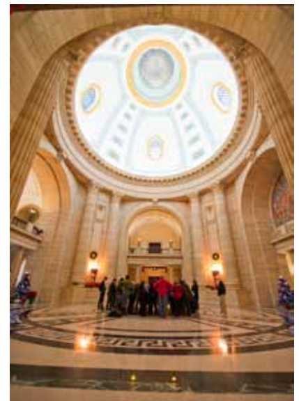
Hermetic Code Tours - Manitoba Legislative Building

Tuklasin ang mga nakatagong kuwento sa isa sa mga palatandaan ng Manitoba – ang Manitoba Legislative Building. Ang arkitekturang kamamangaang ito ay puno ng mga 'occult cue', mga nakatagong hieroglyphic na inskripsiyon, mga numerikong koda at mga simbolong Mason (Freemasonic) na hindi nakita ng mga historiko at mga bisita nang halos isang daang taon. Malaman kung bakit may dalawang sphinx sa bubong at ang kahulugan ng kumikinang na simbolong pigurang nakatingin sa lungsod ng Winnipeg, ang Golden Boy.