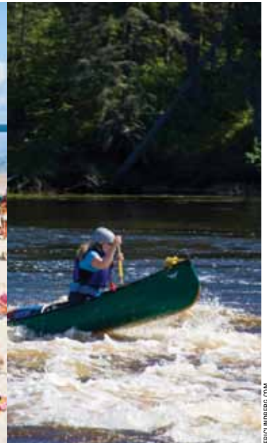
Ang Bloodvein River

Ibabad ang iyong sarili sa nakakakilig na kalikasan ng Manitoba habang sumasagwan ka pababa sa isang makasaysayang ilog, pagsunod sa tradisyonal na mga ruta ng negosyante ng balahibo. O kumuha ng iba't ibang pananaw ng Winnipeg sa pamamagitan ng pagsagwan sa mga malapit sa lungsod na daluyan ng tubig sa kalunsuran.