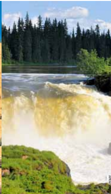
Ang Pisew Falls