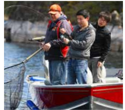
Mga 'Fly-in Fishing Lodge'

Magtagal pa ng oras sa tubig sa isang 'wilderness resort' sa sukal ng puso ng boreal na kagubatan. Dumating sa pamamagitan ng nakalulutang na eroplano at matutunan ang mga sikreto ng pangingsda sa gubat at paano maghanda ng tradisyunal na tanghalian sa baybayin. Sundan ang mga gabay na dinaanan ng mga nangangalakal ng balahibo – ituturo ng mga gabay ang mga sinaunang pictograph na nagpapakita sa kasaysayan ng mga katutubong tao. Maghanap ng moose, itim na oso, caribou at beaver. Makinig sa mga huni ng mga agila, kuwago, mga finches at mga flycatcher. Manatili sa gabi na nakababad sa kultura ng French-Canadian at Métis, na may tradisyunal na pagkain, mga kanta at pagkukuwento.