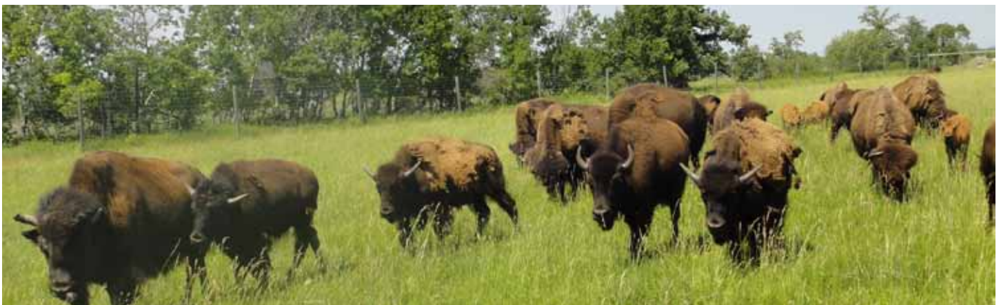
Kalikasan at Kasaysayan ng Winnipeg

Tingnan kung paano ang mga tao at ang lupa ay konektado sa isang kamanghamanghang pagpapakilala sa bison at Katutubo, Métis, mga voyageur at mga tagapanguna na lumakad katabi ng imahe na simbolo na ito ng Manitoba. Tingnan ang kawan ng 30 bison nang malapitan pagkatapos ay sundan ang nakalinyang-yelo na daan papunta sa isang Plains Cree tipi. Pagpasahan ang mga bagay na ginawa mula sa bison, tulad ng makinis na itim na kutsara na ginawa mula sa isang sungay. Isipin na kayanin ang taglamig sa loob ng 'sod roof' na tahanan ng tagapanguna at magpakasaya sa bannock na niluto sa isang bukas na apoy matapos sumagwan ng isang voyageur na canoe sa palibot ng lawa.