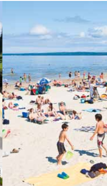
Ang Grand Beach Provincial Park