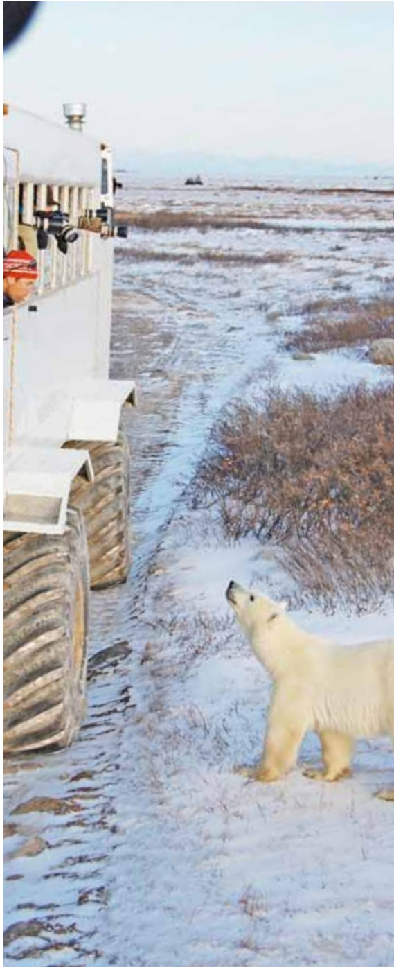
Panonood ng Osong Puti

Mula sa pagtingin sa wildlife papuntang pagkukuwento, mula sa timog na prairie papunta sa hilagang tundra – ang mga pangunahing karanasan ng Manitoba ay nag-aalok ng pagkakataon ng buhay na makita, gawin, tikman at mabuhay sa pinakamahusay na hinahandog ng lalawigan na ito.