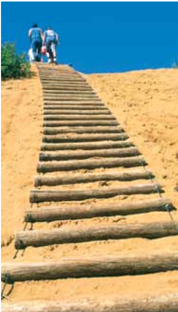
Ang Spirit Sands

Sa Manitoba walang tigil ang mga oportunidad para sa mga panlabas na pakikipagsapalaran. Ang mga hiker, mga siklista at mga skier ay maaaring pumili mula sa daan-daang mga kilometro ng mga landas na paikot-ikot sa mga panlalawigan at pambansang parke ng Manitoba. Pumunta sa itaas ng isang kahanga-hangang talon sa hilagang Pisew Falls Provincial Park. Mag-iwan ng mga bakas sa buhangin sa isang likas na kaibhan ng Manitoba, ang mga sinaunang dune ng Spirit Sands sa Spruce Woods Provincial Park sa kanluran. Lakbayin ang magaspang na kagandahan ng Precambrian Shield sa Whiteshell Provincial Park sa silangan.