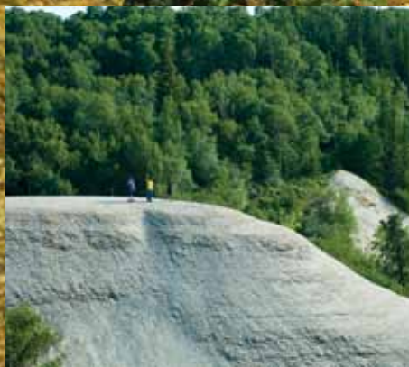
Ang Riding Mountain National Park