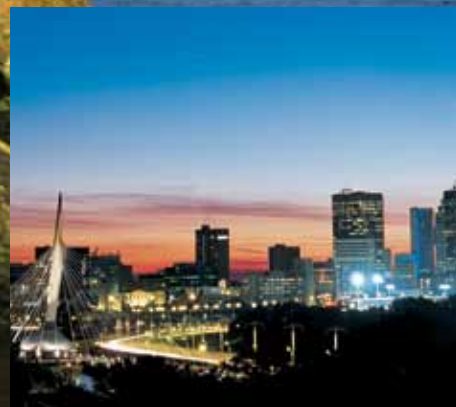
Ang Winnipeg Skyline