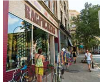
Ang Winnipeg's Exchange District

Maranasan ang kultura ng Manitoba sa mga pangunahin nitong piyesta, katulad ng Folklorama, ang pinakamalaking multicultural na piyesta sa mundo o ang Festival du Voyageur, isang taglamig na selebrasyon ng mga mangangalakal ng balahibo ng Manitoba at mga tradisyong francophone.