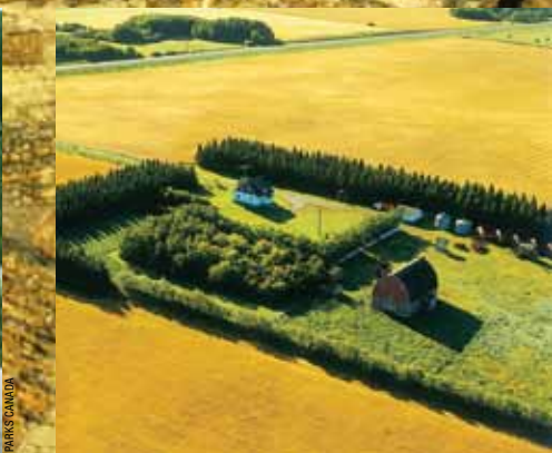
Ang Canola Field