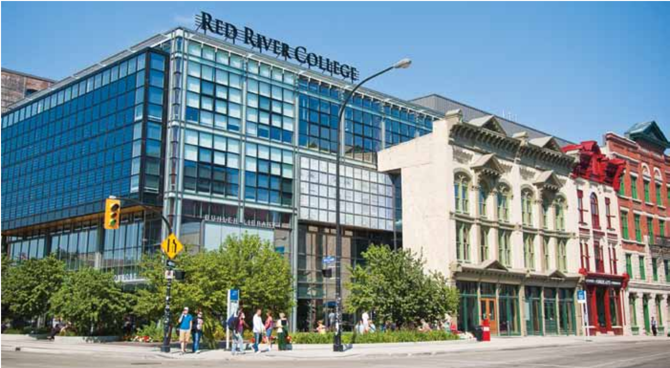
Ang Red River College

Habang ang Manitoba ay nag-aalok ng maraming mga kapapanabik na mga pakikipagsapalaran sa turismo, tulad ng nakikitang mga osong puti at northern lights, ang Manitoba din ay isang magandang lugar upang puntahan at matuto. Gusto mo man matuto ng Ingles o upang makakuha ng pananaw mula sa industriya ng agrikultura ng Manitoba, ang Manitoba ay may mga institusyon at eksperto upang punan ang iyong paghahanap ng kaalaman.