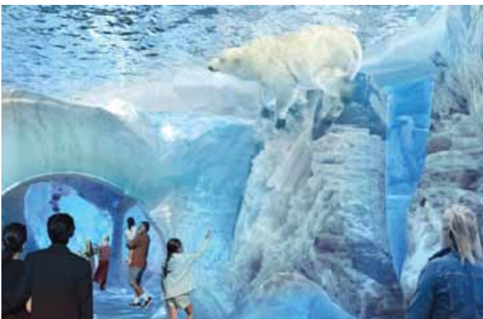
Ang Journey to Churchill exhibit - Ang Assiniboine Park Zoo

Ang Winnipeg ay ang "Pinakabagong Sentro ng Convention ng Canada" – na may binabalak na pagpapalawak ng Winnipeg Convention Centre upang matugunan ang mga pangangailangan ng mga pagpupulong at pagtitipon ngayon. Nagtatampok ng malaking bagong bulwagan at pampublikong espasyo ng lobby, ang karagdagang 69,000 piye kwadrado ng espasyo sa tanghalan ay madaragdag sa umiiral na espasyo ng tanghalan, upang tumanggap ng mahigit sa 700 mga booth para sa pagtatanghal. Ang kahanga-hangang ikatlong palapag na City Room, na matatagpuan sa itaas ng kung ano ngayon ay isang kalye ng lungsod, ay nag-aalok ng mga katangi-tanging tanawin ng lungsod. Sa ibaba, sa antas ng kalye ay isang bagong lugar ng pagtitipon sa gitna ng downtown Winnipeg.